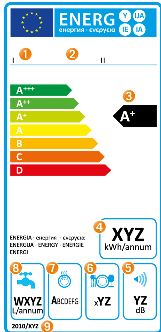
Abbildung: Fachverband Elektroapparate für Haushalt und Gewerbe Schweiz (FEA)